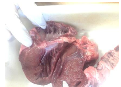
Blick in ein Schweineherz

Wie sind ein Herz und das Auge eines Säugetiers gebaut? Wie funktionieren diese Organe? Wir lösen diese Fragen beim Sezieren von Präparaten.